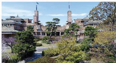
建築学研究科が共同で使用する歴史的建造物の校舎 甲子園会館