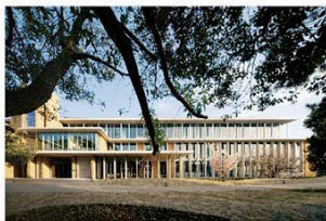
建築学専攻の校舎 建築スタジオ