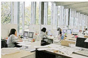
一人ひとりに専用の製図機とパソコンを備えたスタジオ (製図室)